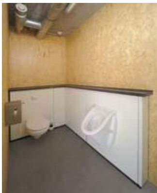
Raum 6 Behinderten WC