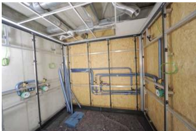
Einhängen der Wandverkleidung