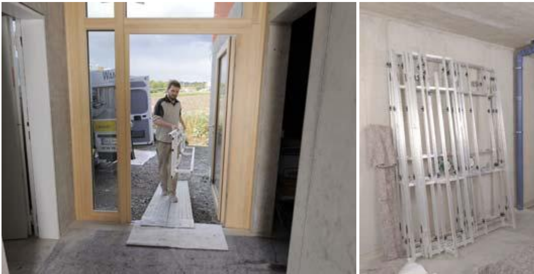
Montage der Duschwannen - Unterkonstruktion, und Duschwannen