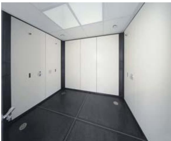
Umkleide Herren Waschtisch mit U-Schrank