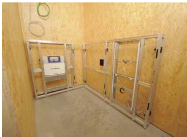
Raum 2 Herren WC