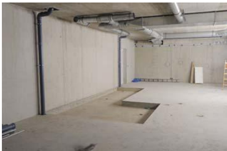
Anlieferung der Trockenbauwände