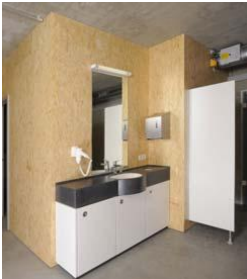
Umkleide Damen Waschtisch mit U-Schrank