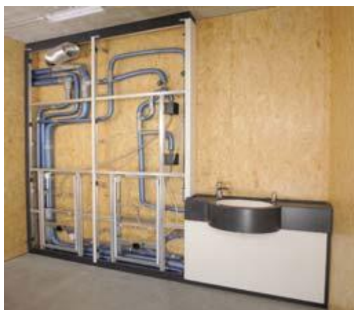
Raum 7 Duschanlage Herren