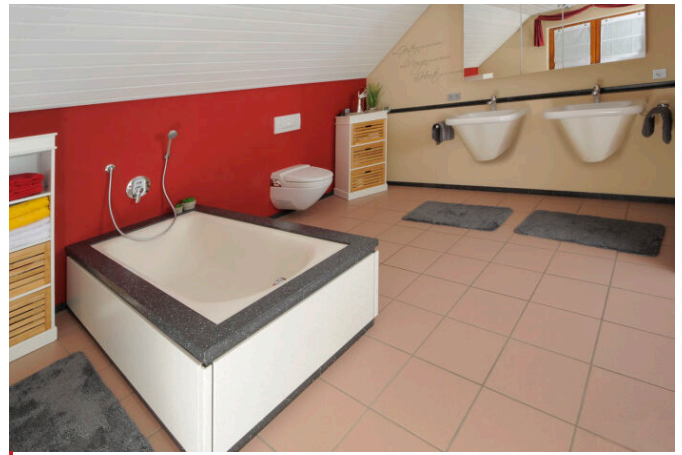
Verkleidete Badewanne mit Waschbecken und Spiegelschrank