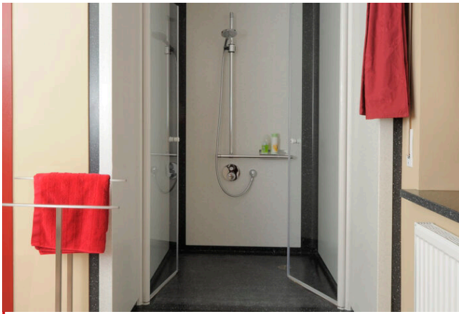
Nischendusche mit geöffneten Türen