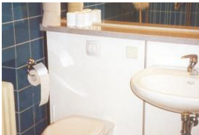
HUG-Feriedorf Isny im Allgäu