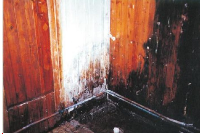
Situation und Ausgangslage vor der Sanierung