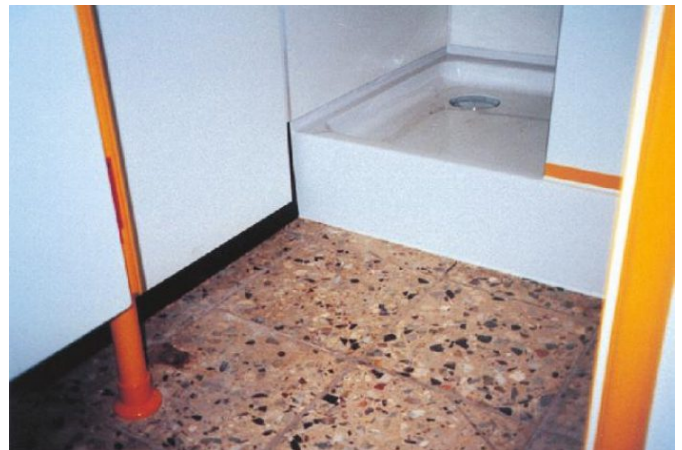
Umsetzung und Optik nach der Sanierung