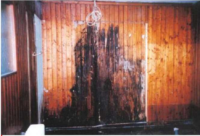
Situation und Ausgangslage vor der Sanierung