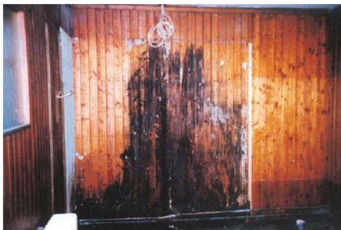
Situation und Ausgangslage vor der Sanierung