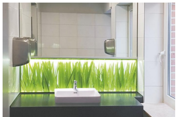
Einzel – Gaßte Waschtisch mit beleuchteter Nischenrückwand und Spiegel sowie Fensteranpassung