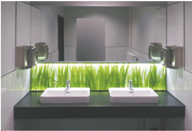
Doppel-Ga steWaschtischanlage mit beleuchteter Nischenru ckwand und Spiegel