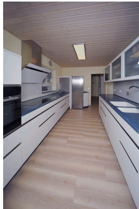
Ansicht vom Eingang