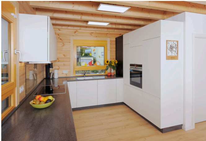
Hug Küche gesamt