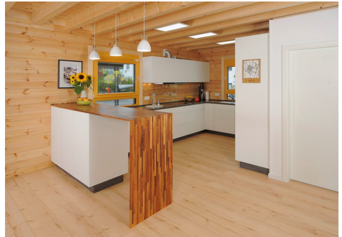
Hug Küche mit Tresen