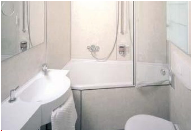
Gästezimmer mit BW und minimaler Ausstattung