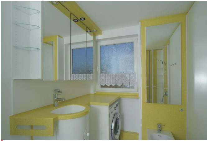
Prexel Waschtisch Spiegel