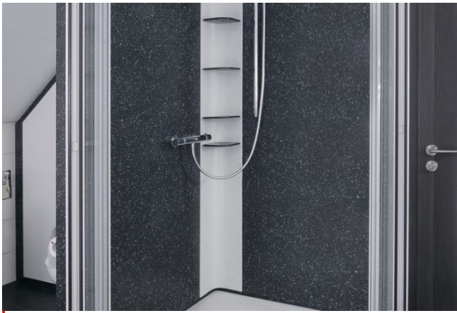
Duschglastüren nach aussen geöffnet