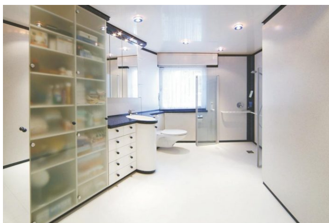
Bad Baier einschl. individueller Möbelgestaltung