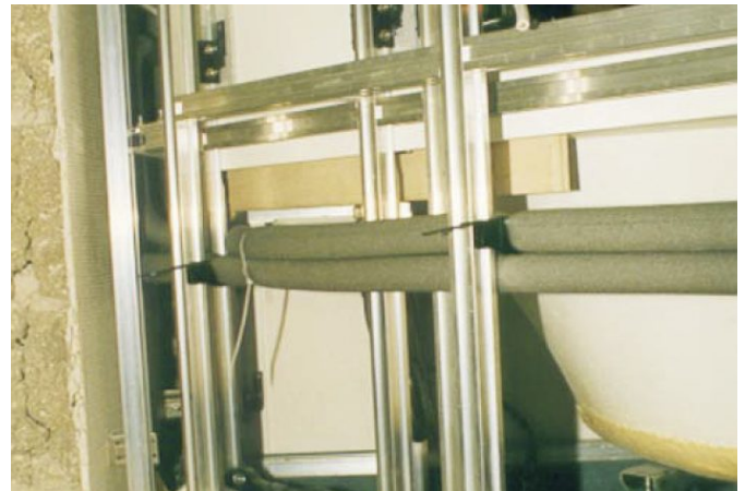
Schallentkopplung zum Boden